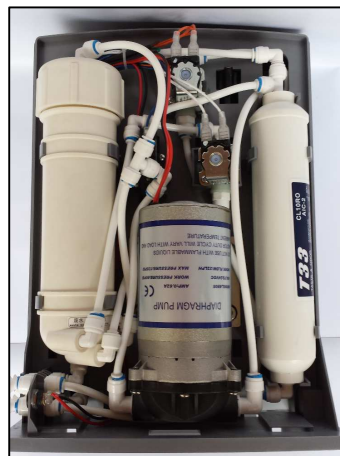
System geöffnet: Vorder- und Rückseite